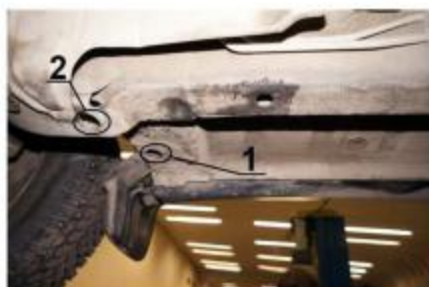
Рис.2 Место установки переднего кронштейна