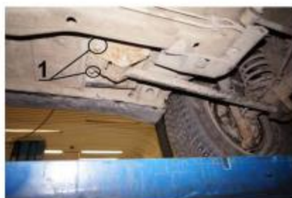
Рис.3 Место установки заднего кронштейна