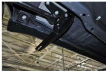
Рис.5 Установка заднего кронштейна