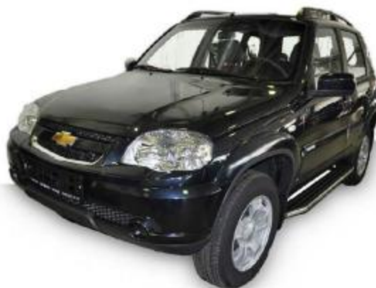
Рис.6 Вид автомобиля с порогом