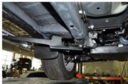
Рис.4 Установка переднего кронштейна